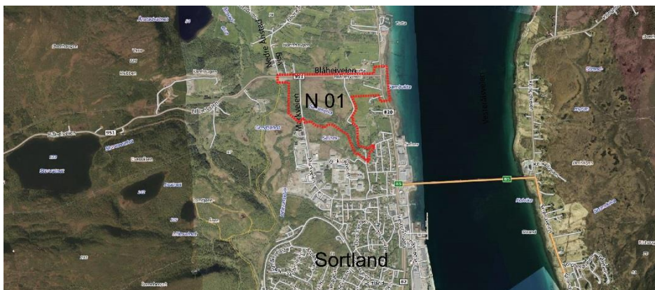
Figur 1 Oversiktskart

Tiltakshaver er Sortland Kommune, mens Rambøll står for utarbeidelse av reguleringsarbeidet.